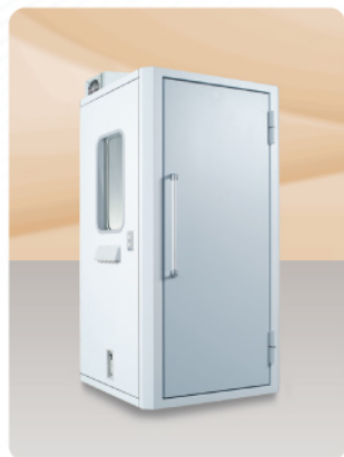
遮音効果 (残響室にて測定)