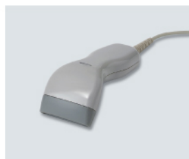
バーコードリーダー